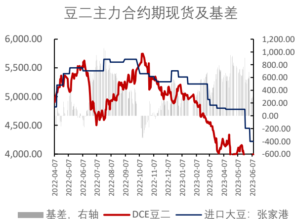
图表 5: 豆粕合约变动 (元/吨)