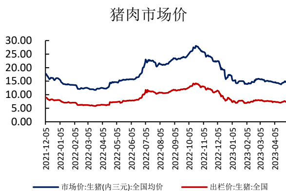
图表 11: 猪肉市场价 (元/公斤)