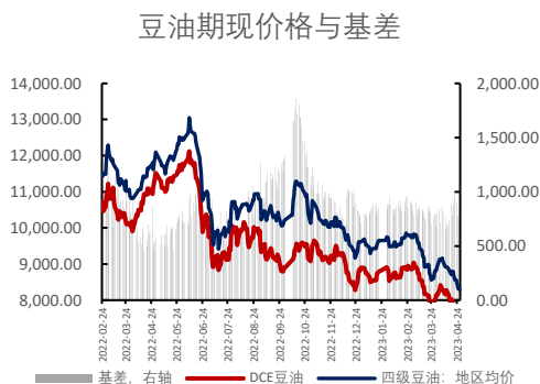
图表 6：豆油合约价格变动（元/吨）