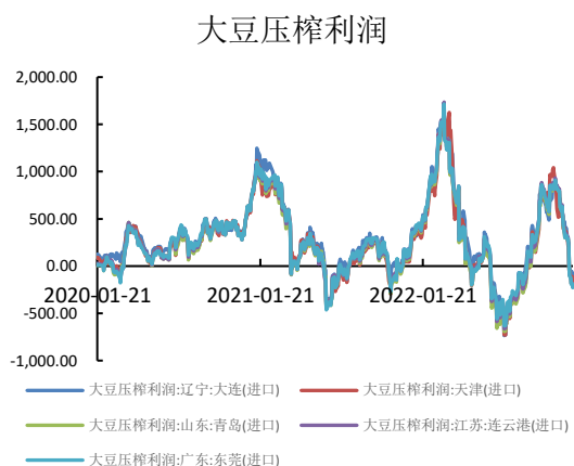
图表 6: 大豆压榨利润 (元/吨)