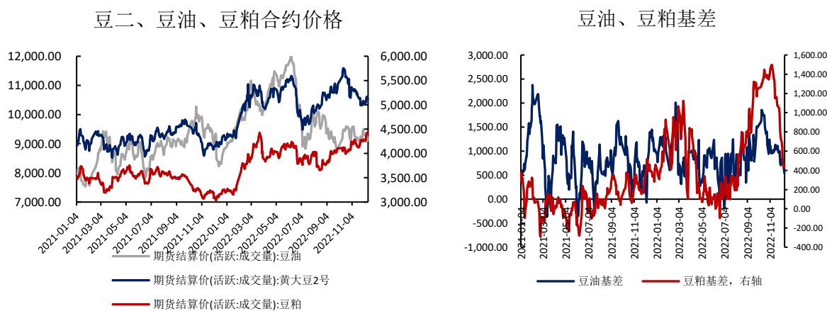
图表 5: 豆油、豆粕价基差 (元/吨)