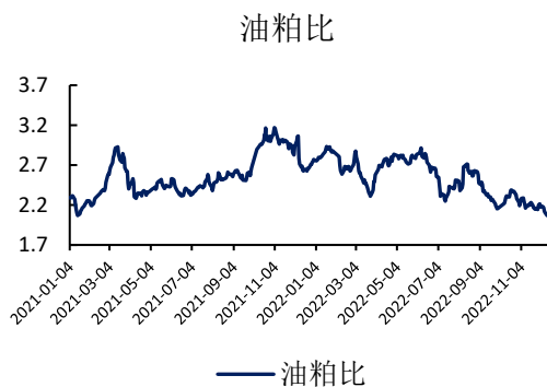
图表 8: 油粕比