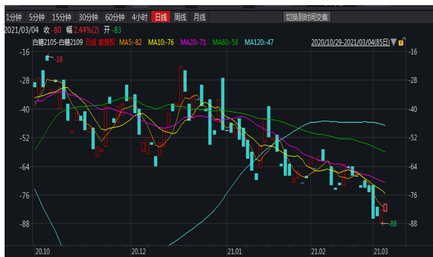
图 1: 郑糖 5-9 价差