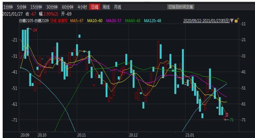
图 1: 郑糖 5-9 价差