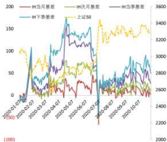
图 3 上证 50 股指期货各合约基差