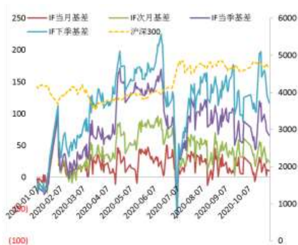
图 2 沪深 300 股指期货各合约基差