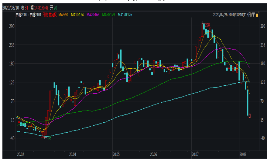
图 1：郑糖 9-1 价差