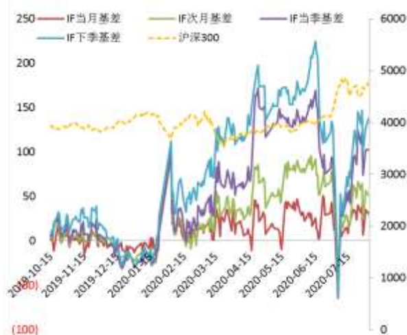
图 2 沪深 300 股指期货各合约基差