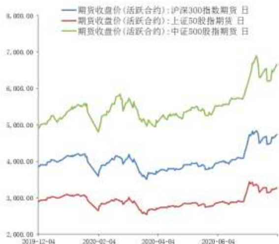
图 1 股指期货主力合约走势图