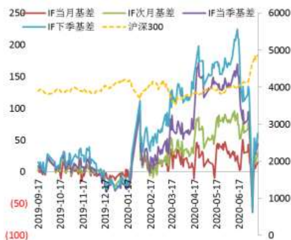
图 2 沪深 300 股指期货各合约基差