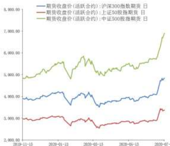
图 1 股指期货主力合约走势图