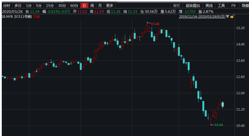
图 2：美 11 号糖主连日线