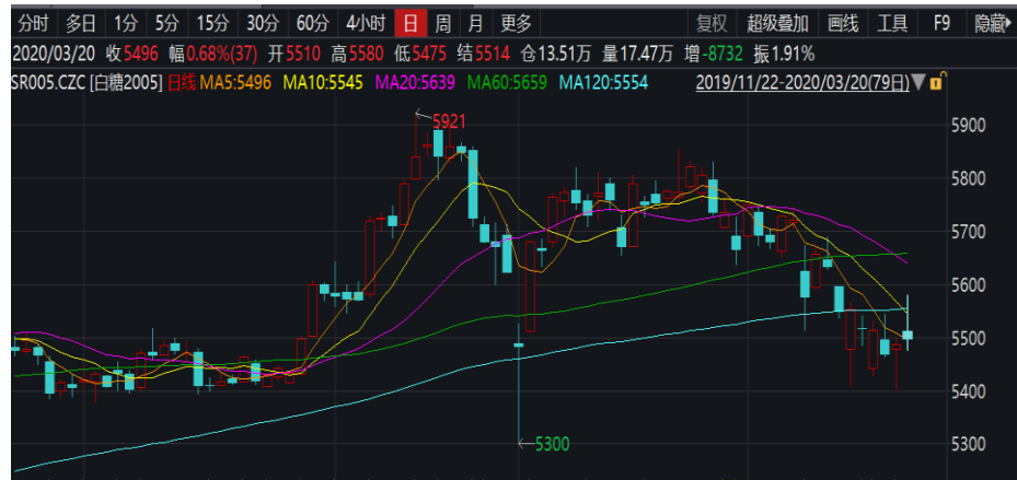
图 1：郑糖 2005 日线