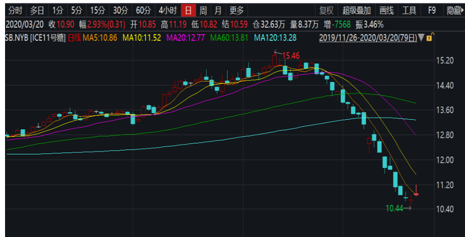
图 2：美 11 号糖主连日线