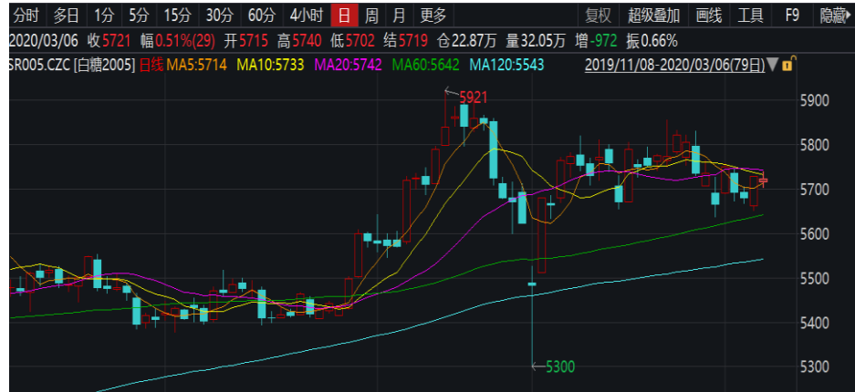
图 1：郑糖 2005 日线