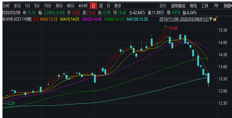
图 2：美 11 号糖主连日线