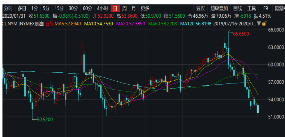
图 2：美原油主连日线