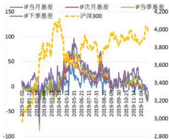
图 2 沪深 300 股指期货各合约基差