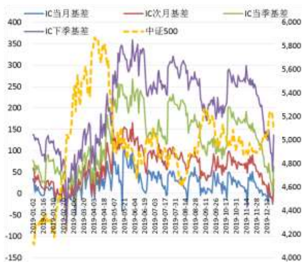
图 4 中证 500 股指期货各合约基差