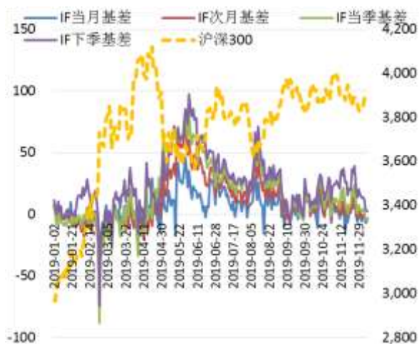
图 2 沪深 300 股指期货各合约基差