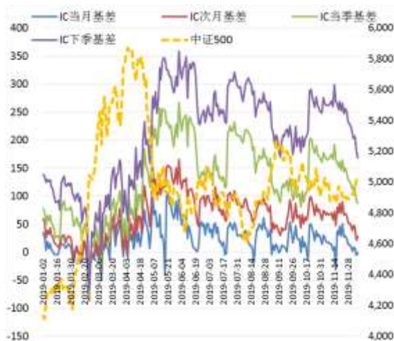
图 4 中证 500 股指期货各合约基差