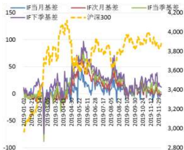
图 2 沪深 300 股指期货各合约基差