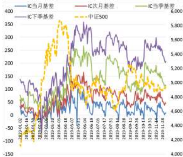
图 4 中证 500 股指期货各合约基差