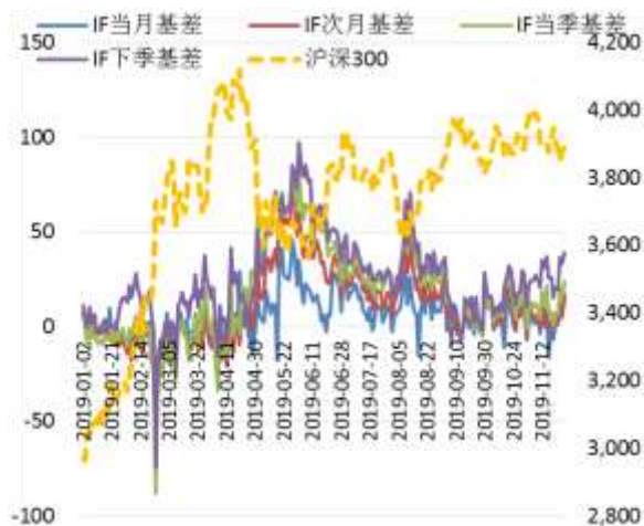
图 2 沪深 300 股指期货各合约基差