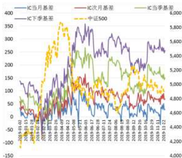
图 4 中证 500 股指期货各合约基差