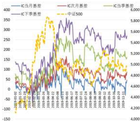
图 4 中证 500 股指期货各合约基差