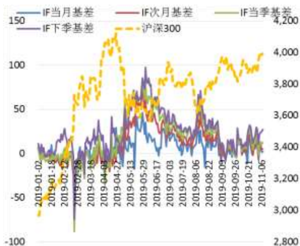
图 2 沪深 300 股指期货各合约基差