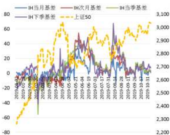
图 3 上证 50 股指期货各合约基差