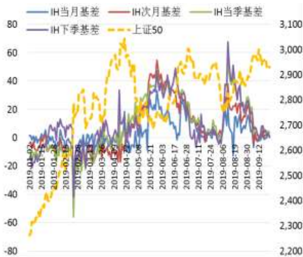
图 3 上证 50 股指期货各合约基差