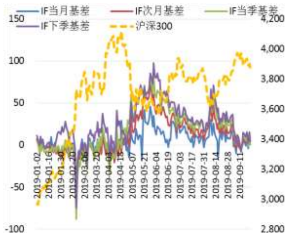
图 2 沪深 300 股指期货各合约基差