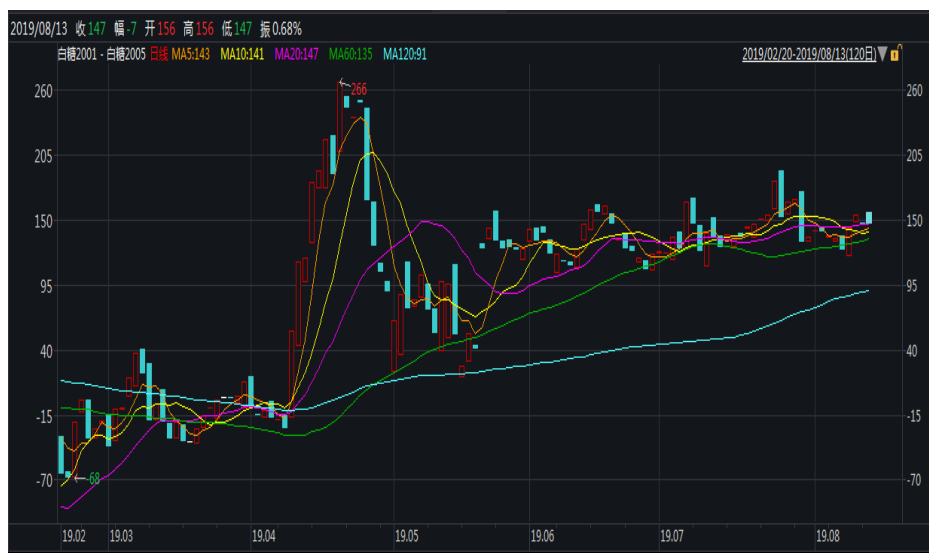
图 1：郑糖 1-5 价差