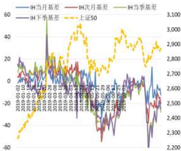
图 3 上证 50 股指期货各合约基差