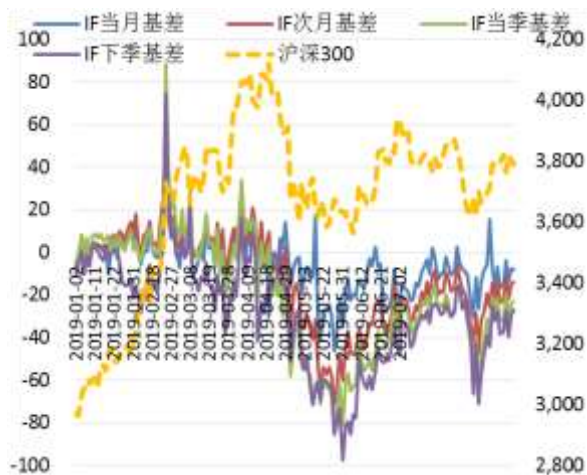
图 2 沪深 300 股指期货各合约基差