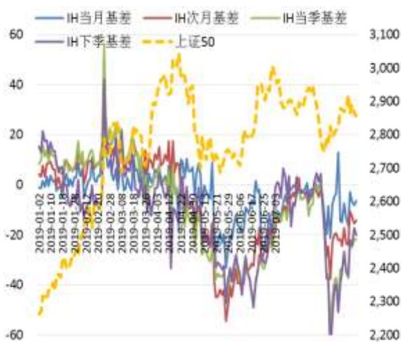
图 3 上证 50 股指期货各合约基差