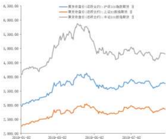
图 1 股指期货主力合约走势图

主力合约 IF1909、IH1909、IC1909， 跌幅分别为-1.25%， -1.44%， -0.69%。