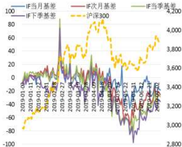
图 2 沪深 300 股指期货各合约基差