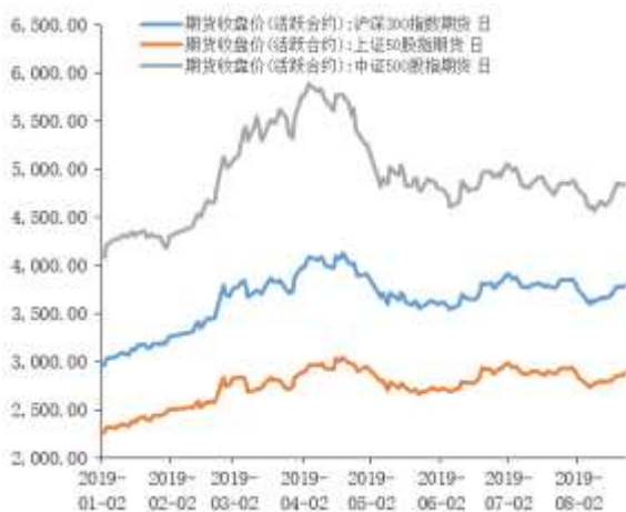
图 1 股指期货主力合约走势图

主力合约 IF1909、IH1909、IC1909， 涨幅分别为 0.73%，1.33%，0.04%。