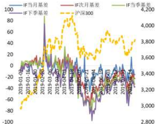
图 2 沪深 300 股指期货各合约基差