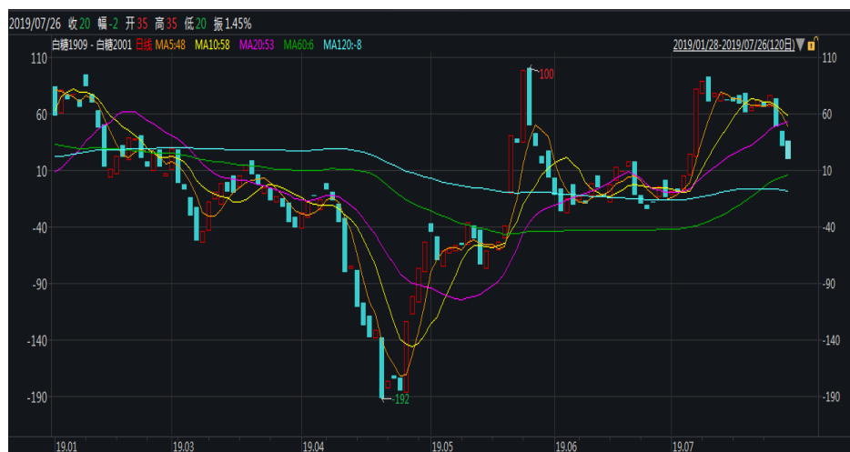
图 1：郑糖 9-1 价差