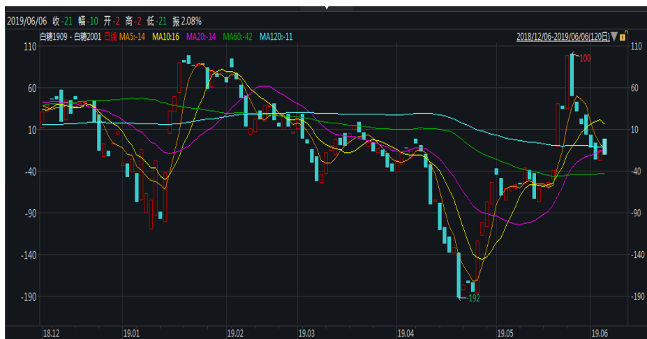
图 1：郑糖 9-1 价差