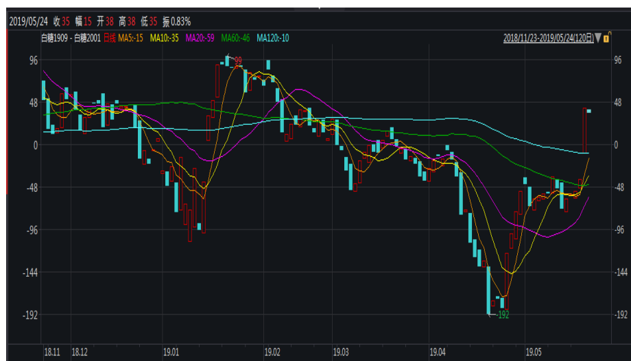
图 1：郑糖 9-1 价差