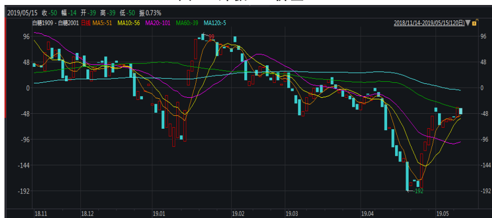
图 1：郑糖 9-1 价差