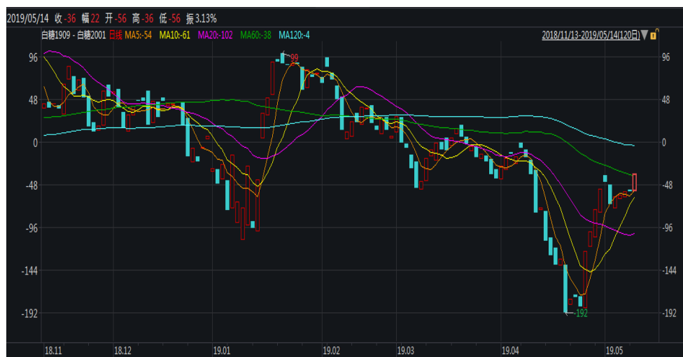
图 1：郑糖 9-1 价差