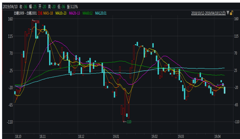
图 1：郑糖 9-1 价差