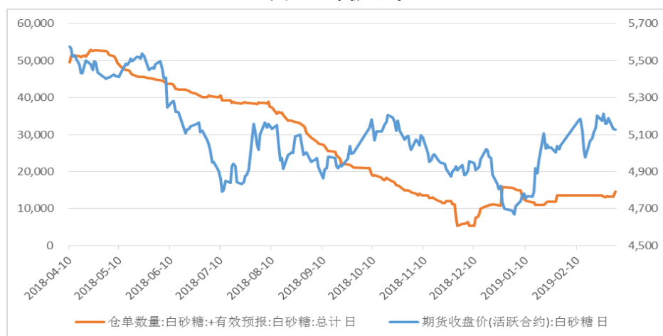
图 2: 郑糖仓单