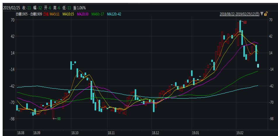
图 1：郑糖 5-9 价差