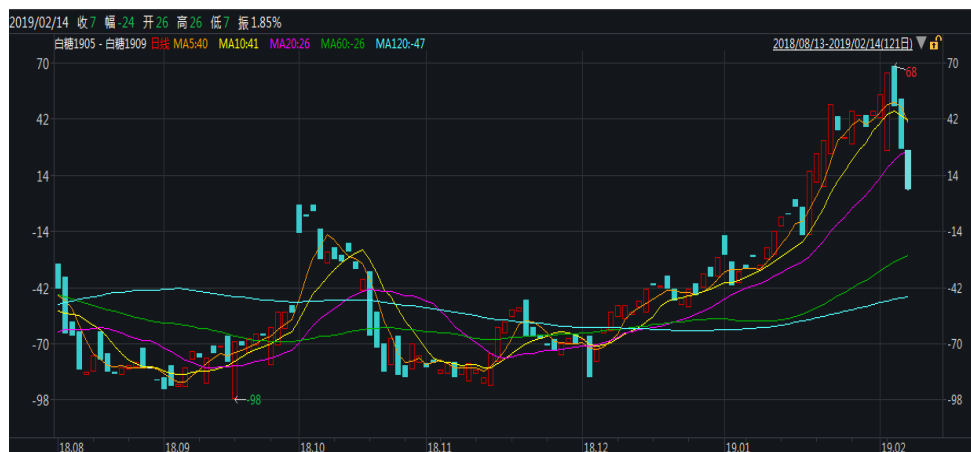
图 1: 郑糖 5-9 价差