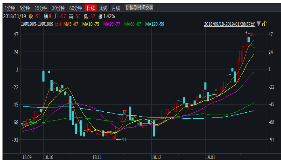
图 1：郑糖 5-9 价差