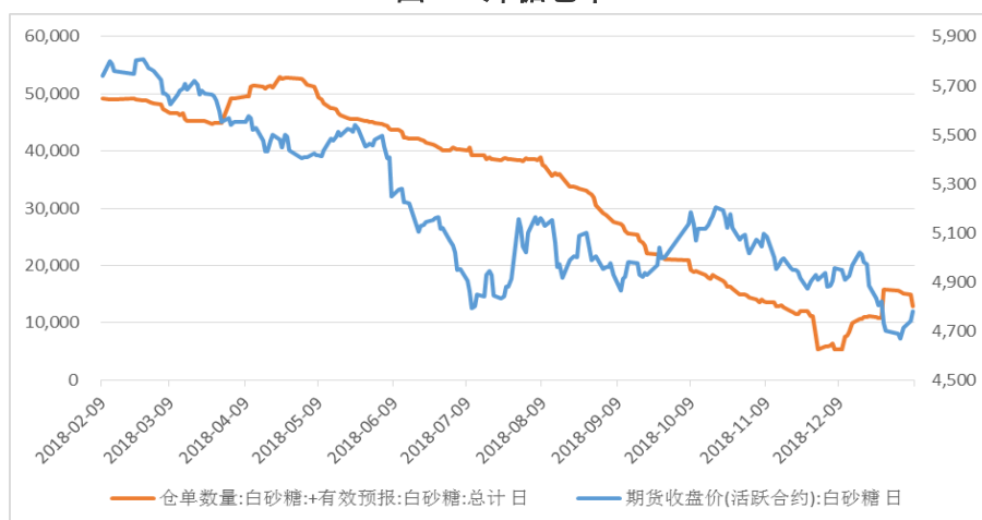
图 2: 郑糖仓单