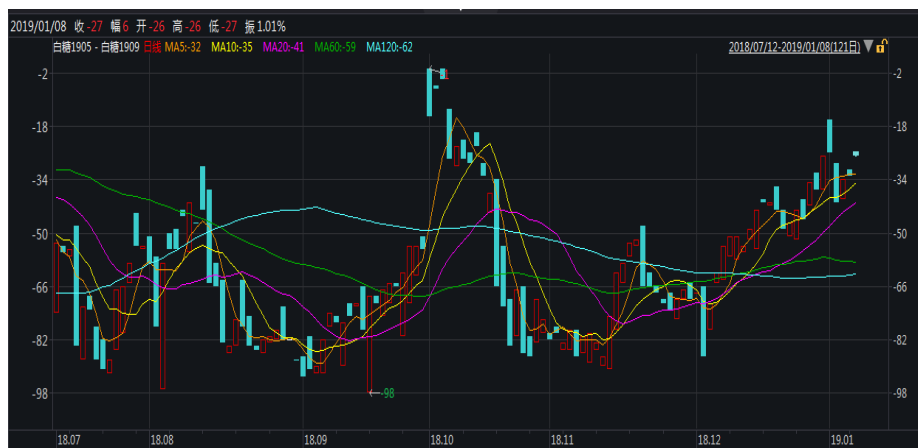
图 1: 郑糖 5-9 价差