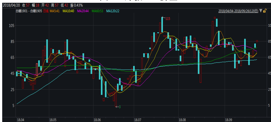
图 1: 郑糖 1-5 价差