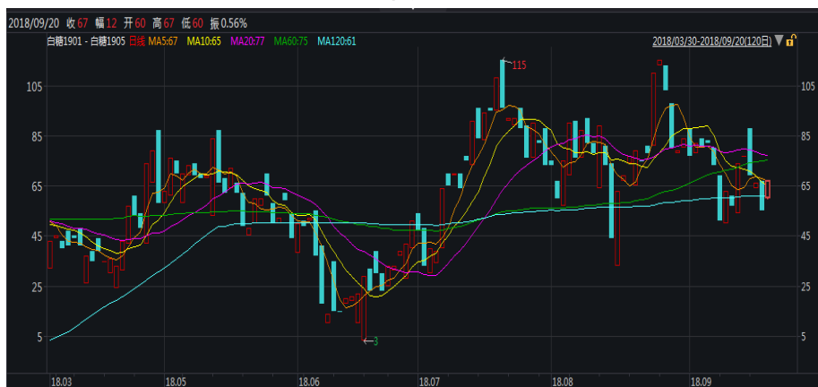
图 1: 郑糖 1-5 价差