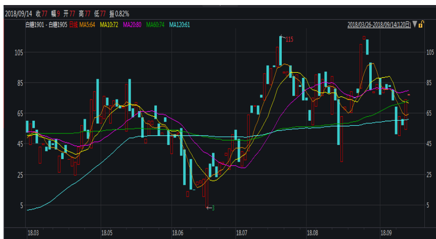
图 1: 郑糖 1-5 价差