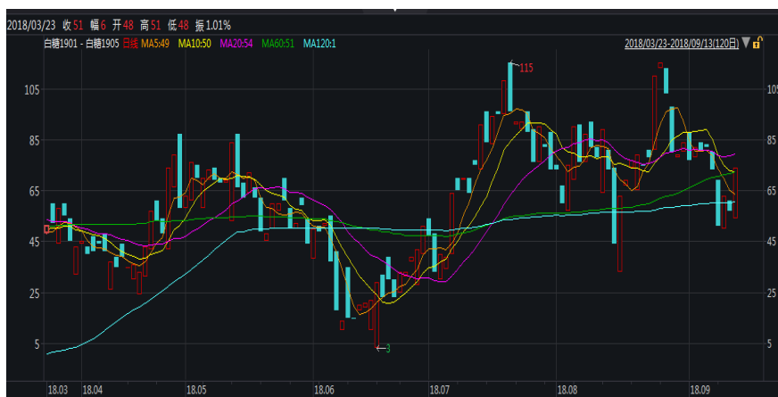
图 1: 郑糖 1-5 价差