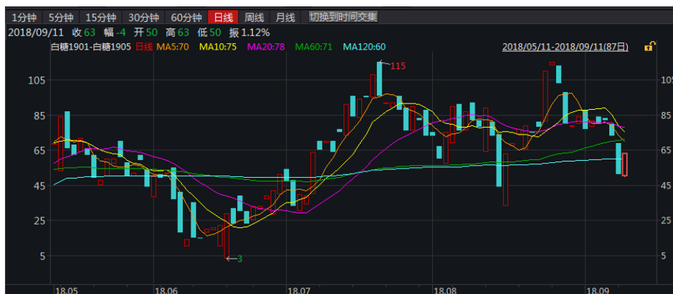
图 1: 郑糖 1-5 价差