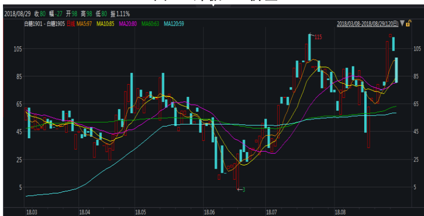
图 1：郑糖 1-5 价差