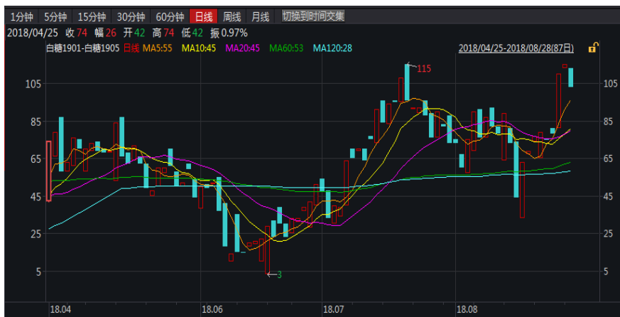
图 1: 郑糖 1-5 价差