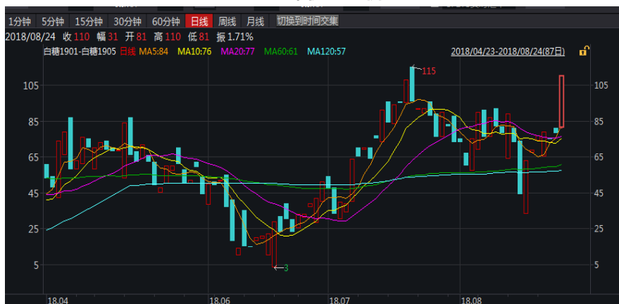
图 1: 郑糖 1-5 价差