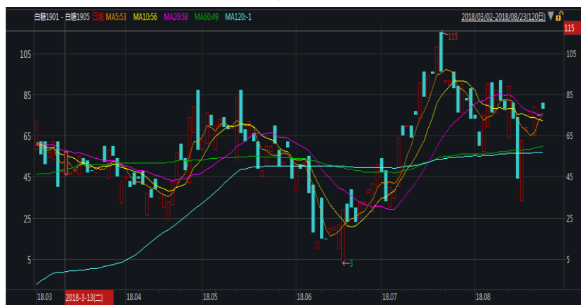
图 1: 郑糖 1-5 价差