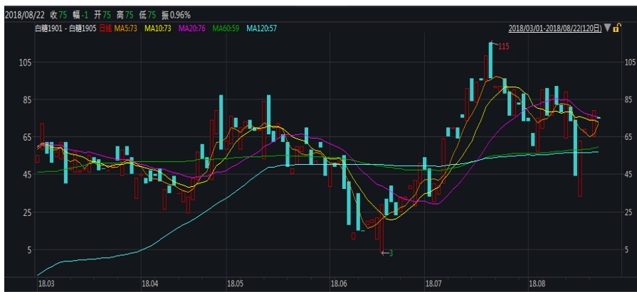
图 1: 郑糖 1-5 价差