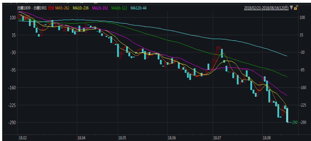
图 1: 郑糖 9-1 价差