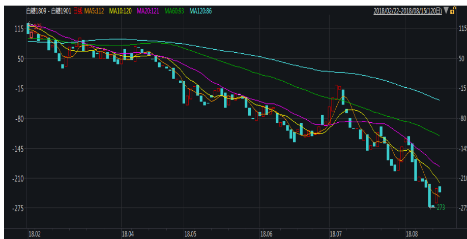
图 1: 郑糖 9-1 价差